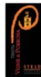
Tenuta Vigne a Porrone - Grosseto