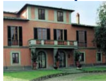
In alto, la Tenuta La Fuga di Montalcino; sopra, ancora la Tenuta Nozzole.