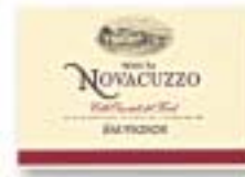
Colli Orientali del Friuli