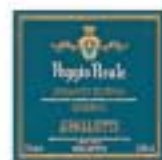
Chianti Rufina Riserva

F 50022 - Greve in Chianti - FIRENZE Loc. Passo del Pecora Via di Nozzole, 12 Tel. 055 859811 - Fax 055 859823 e-mail: folonari@tenutefolonari.it www.tenutefolonari.it